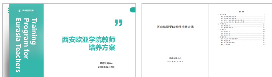
图 2 《西安欧亚学院教师培养方案》