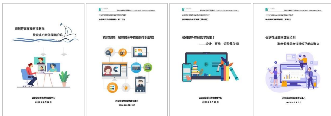
图 4 《在线教学教师学习》资料

(2) 已发布 4 期《在线教学教师学习》资料，为全校教师提供在线教学提供理论和实践方法的支持。