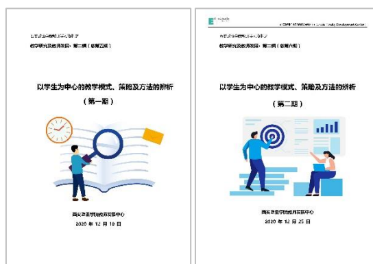
图 5 《“以学生为中心”的教学模式、策略、方法辨析》手册

• 支持教师开展教学研究方面 已发布 2 期《“以学生为中心”的教学模式、策略、方法辨析》手册，为老师们的课程案例研究 提供教学模式、策略和方法方面的 理论及实践方法支持。